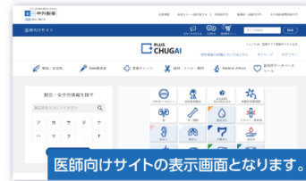
医師向けサイトの表示画面となります。